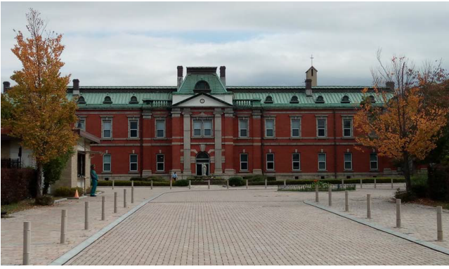
聖母女学院 ・旧陸軍十六師団指令部跡 明治41年建設

聖母女学院→深草十二帝陵→喜祥寺 →真宗院→瑞光院→宝塔寺 →公園でお弁当（各自で持参の事）・休憩