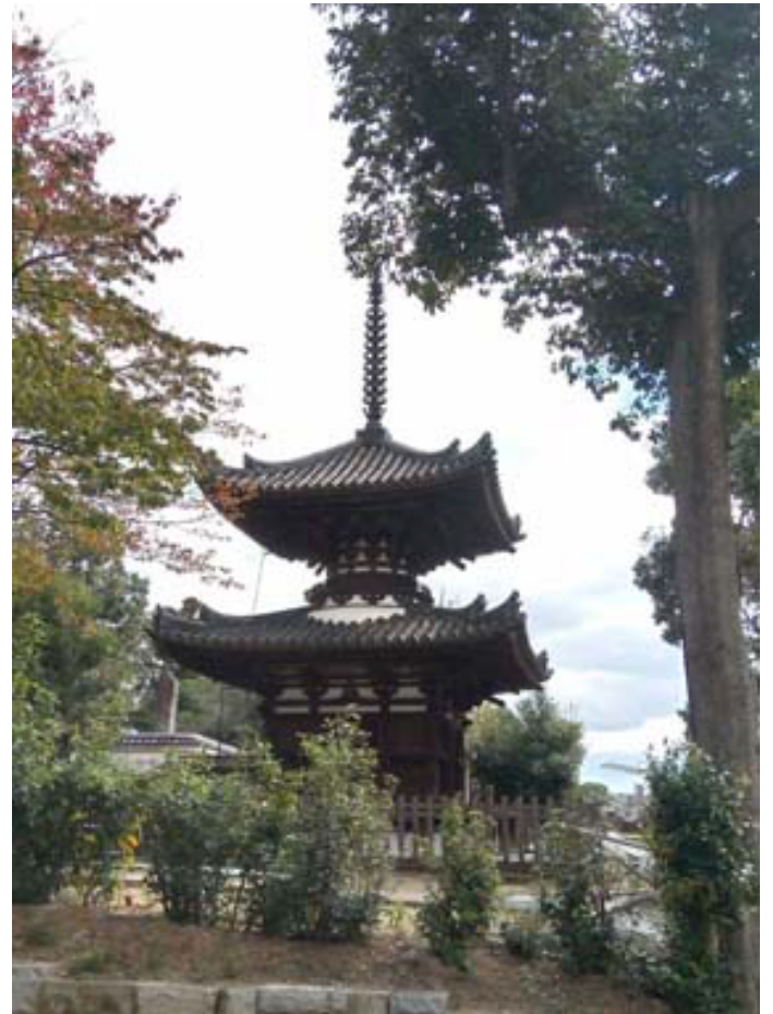
宝塔寺 多宝塔（重文）