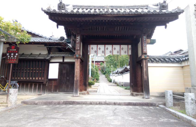
宝塔寺 ・『源氏物語』の舞台で知られる極楽寺跡