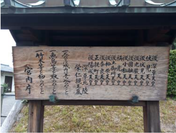
深草十二帝陵 ・後深草から後陽成までの北朝天皇陵