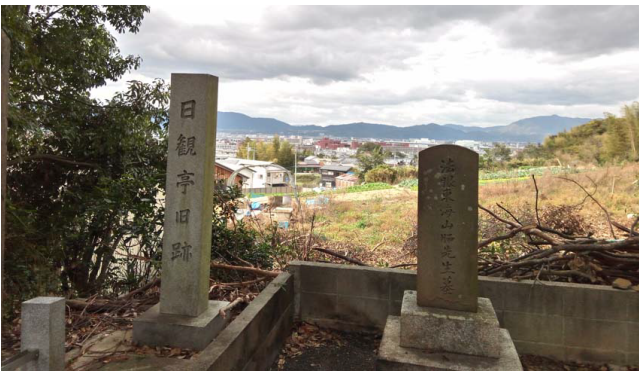
真宗院 ・山脇東洋の墓